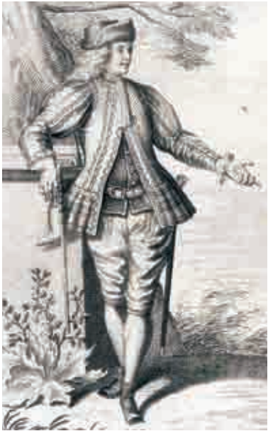
Kupferstich, Christoph Weigel 1721: Summus officinarum aerariarum Circuitor, (Der ober Hütten Reitter)

Im Wendener Land begegnen sich Natur und Technik, die in der Wendener Hütte zu einem unzertrennlichen Paar verschmelzen. Die Natur stellte die Ressourcen für unsere florierende Wirtschaft - die Nutzung der Ressourcen war Antrieb für technische Innovationen.